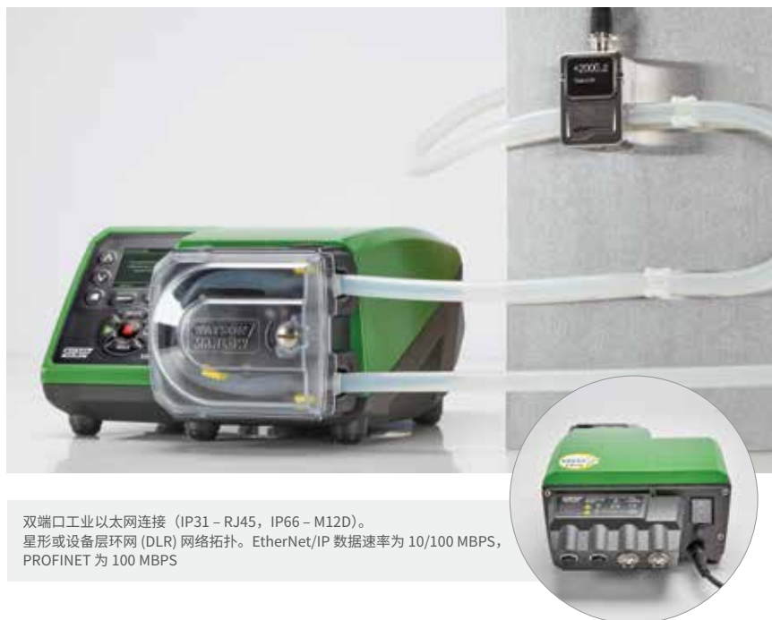
双端口工业以太网连接 (IP31 – RJ45, IP66 – M12D)。星形或设备层环网 (DLR) 网络拓扑。EtherNet/IP 数据速率为 10/100 MBPS, PROFINET 为 100 MBPS